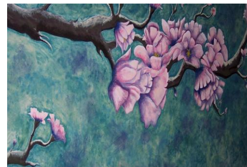
Ζωγραφική σε τοίχο των: Θεοδώρας Θεολόγου(Β) & Σοφίας Καλλιμίντζου (Β')

http://www.minedu.gov.gr/publications/docs2018/%CF%85%CE%B1_%CF%86%CE%BF%CE%B9%CF%84%CE%B7%CF%83%CE%B7%CF%82_24_01_18.pdf