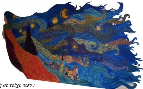
Ζωγραφική σε τοίχο των : Καλλιίδου Γεωρ.(απόφοιτος 2017-18)) & Μοντάφη Νάγιας (απόφοιτος 2018-19))

και ειδικές εκπαιδευτικές ανάγκες που φοιτούν σε σχολεία της Δευτεροβάθμιας Εκπαίδευσης, η φοίτησή τους θεωρείται επαρκής όταν το σύνολο των επιπλέον απουσιών δεν υπερβαίνει το τριάντα τοις εκατό (30%) των προβλεπόμενων από το οικείο αναλυτικό πρόγραμμα σπουδών με βάση το ωρολόγιο πρόγραμμα.