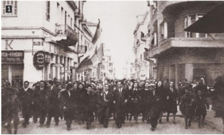
25 Μαρτίου 1942: Το συγκεντρωμένο πλήθος άρχισε να κατευθύνεται προς το μνημείο του Άγνωστου Στρατιώτη, όπου θα συγκρουστεί με την κατοχική αστυνομία

Υπό τη σκιά των εντάσεων την επόμενη μέρα η κατοχική κυβέρνηση Τσολάκογλου παρίσταται σε δοξολογία στην Μητρόπολη και στη συνέχεια μεταβαίνει για κατάθεση στεφάνου στον Άγνωστο Στρατιώτη.