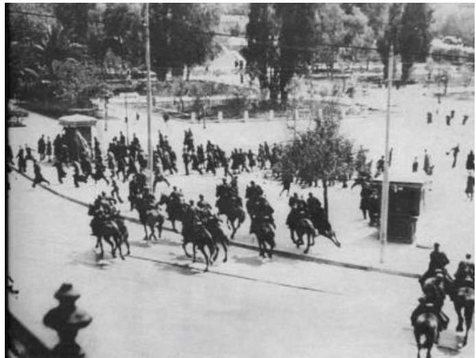
25 Μαρτίου 1943: Έφιππες ιταλικές δυνάμεις, ρίχνοντας αβίαστα στο «ψαχνό», εξαπέλυσαν απανωτές εφόδους για να διαλύσουν το συγκεντρωμένο πλήθος.

Παρά την απαγόρευση όμως και στην επέτειο του 1943 , ο κόσμος ξεχύθηκε στους δρόμους με πρώτο σημείο συγκέντρωσης το Πεδίο του Άρεως. Ακολούθησαν και άλλες συγκεντρώσεις στο Κολωνάκι και στα Προπύλαια. Δεκάδες χιλιάδες Αθηναίοι πήραν μέρος στη διαδήλωση η οποία λίγο μετά την έναρξη της δέχθηκε επίθεση από Ιταλούς καραμπινιέρους. Η διαδήλωση συνεχίστηκε και οι δυνάμεις καταστολής συνέχισαν της επιθέσεις τους. Απολογισμός 4 νεκροί . Την ίδια ώρα αντίστοιχη κινητοποίηση πραγματοποιήθηκε στη Θεσσαλονίκη η οποία έπαιρνε έντονο αντιφασιστικό χαρακτήρα.