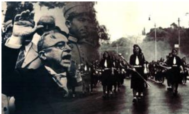
Ο Μεταξάς και το καθεστώς της 4ης Αυγούστου θα ασχοληθεί ιδιαίτερα με την ανάπτυξη της στρατιωτικής συνείδησης της νεολαίας και θα χρησιμοποιήσει τις παρελάσεις ως όργανα για την επίτευξη των σκοπών του. Κατά τη διάρκεια της δικτατορίας του Μεταξά οι παρελάσεις πραγματοποιούνται την 25η Μαρτίου, στην επέτειο της επιβολής της 4ης Αυγούστου και σε άλλες τοπικές «εθνικές εορτές».

Το τελετουργικό των εορτασμών δεν ήταν σταθερό και αμετάβλητο στον 19 ο αιώνα και τον μεσοπόλεμο. Τα δρομολόγια των παρελάσεων άλλαζαν συχνά, όπως και οι συμμετέχοντες - με εξαίρεση φυσικά το στρατό. Επιπλέον η παρουσία των μαθητών στις παρελάσεις μέχρι το 1936 δεν φαίνεται να είχε επίσημο, πανελλαδικό και αυστηρά συμπληρωματικό προς τη στρατιωτική παρέλαση χαρακτήρα. Μοιάζει δε περισσότερο να οργανώνεται με πρωτοβουλίες από τοπικούς ή σχολικούς φορείς. Η κατάσταση αυτή θα αλλάξει το 1936.